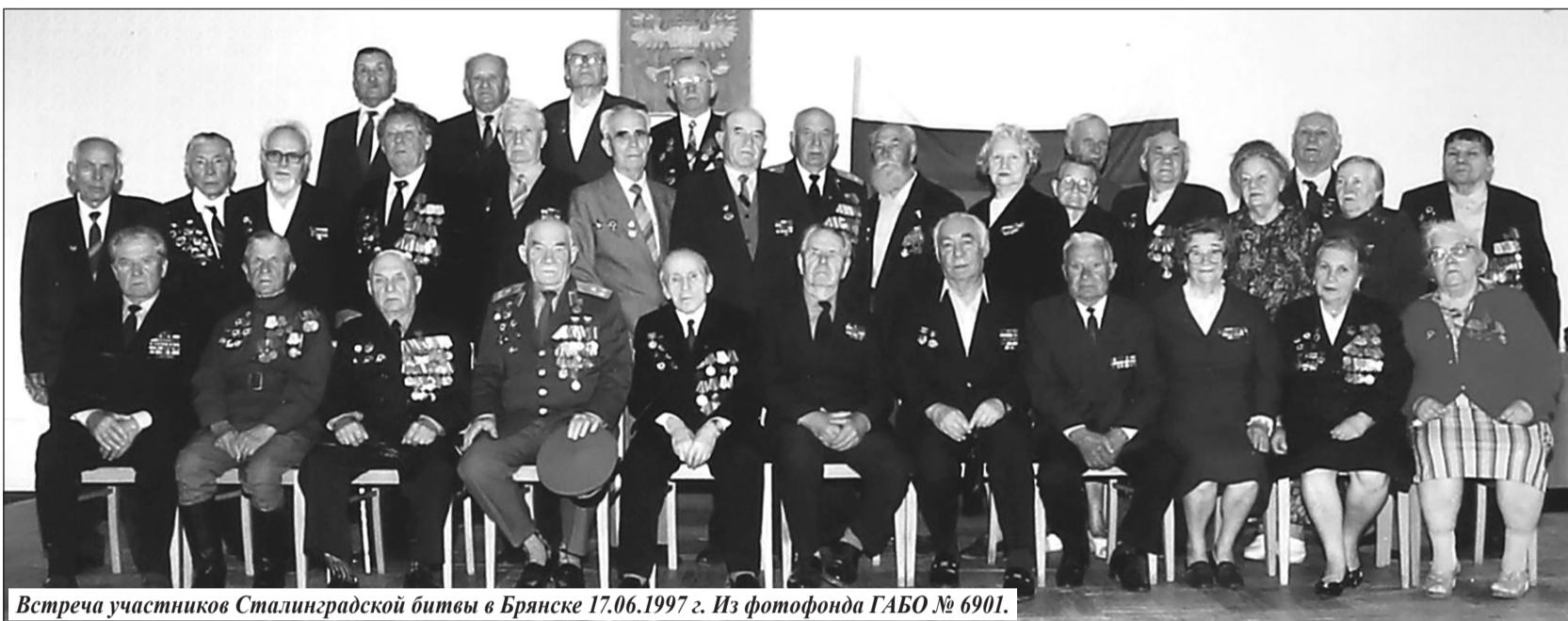
Встреча участников Сталинградской битвы в Брянске 17.06.1997 г.

Эта битва стала одной из крупнейших в Великой Отечественной войне и длилась с июля 1942-го