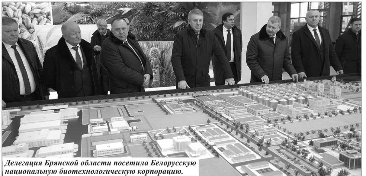
Делегация Брянской области посетила Белорусскую национальную биотехнологическую корпорацию.

В ходе рабочей встречи обсуждалась важная составляющая российско-белорусского сотрудничества – обмен опытом, возможность учиться друг у друга в разных сферах. Сельское хозяйство – еще одна отрасль, которая объединяет наши государства.