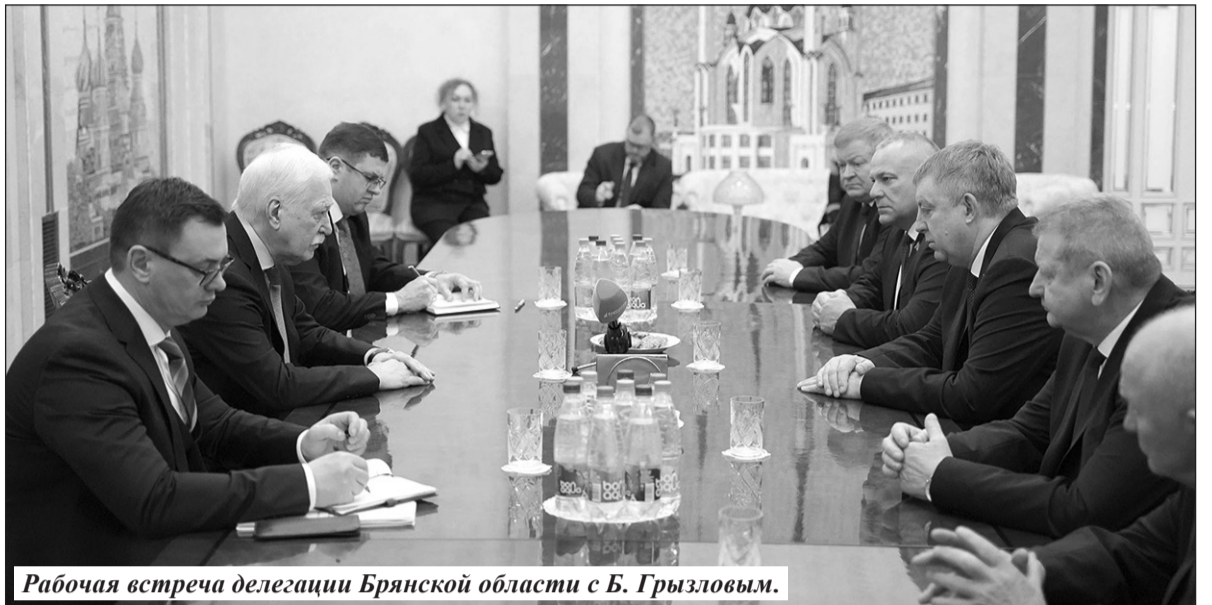
Рабочая встреча делегации Брянской области с Б. Грызловым.

Надо подчеркнуть, что Гомельщина отработала хорошую систему поддержки 150 лучших спортсменов – за выдающиеся ре-