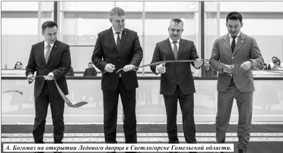
А. Богомаз на открытии Ледового дворца в Светлогорске Гомельской области.

спортсменов самого разного возраста: большая и малая ледовые арены, залы игровых видов спорта и хореографии, бассейн, лыжероллерная трасса.